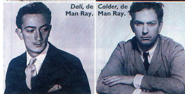
Dalí, de Man Ray. Calder, de Man Ray.